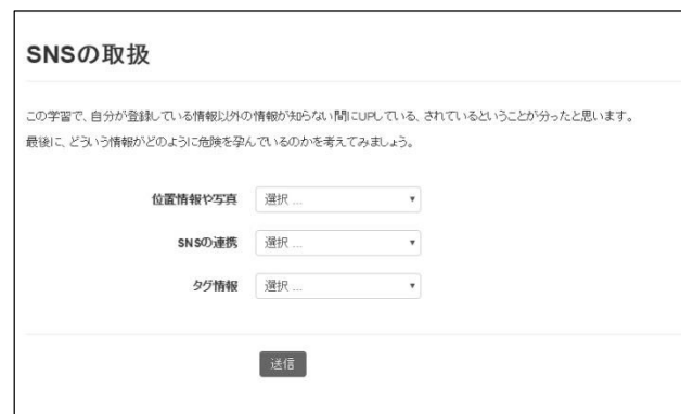
図3 Moodle レッスンモジュール学習画面