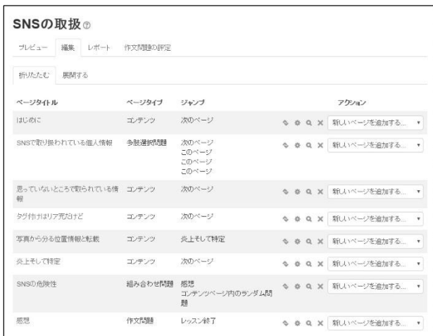
図1 Moodle レッスンモジュール作成画面

分岐が複数ページあった場合、各分岐ページの設定に戸惑う。また、デフォルトでは「このページ」となっているため、気づかず分岐できていない場合もある(図1)。